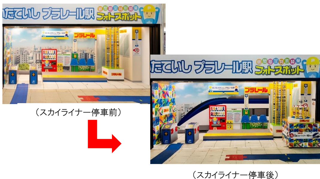
フォトスポット「けいせいたていし プラレール駅」

これまでに連動企画として、記念乗車券の販売や、スタンプラリー・クイズキャンペーンを実施するなど、お客様に楽しんでいただける企画を実施しています。