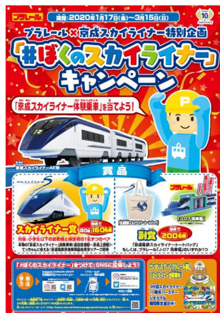
キャンペーンポスター（イメージ）