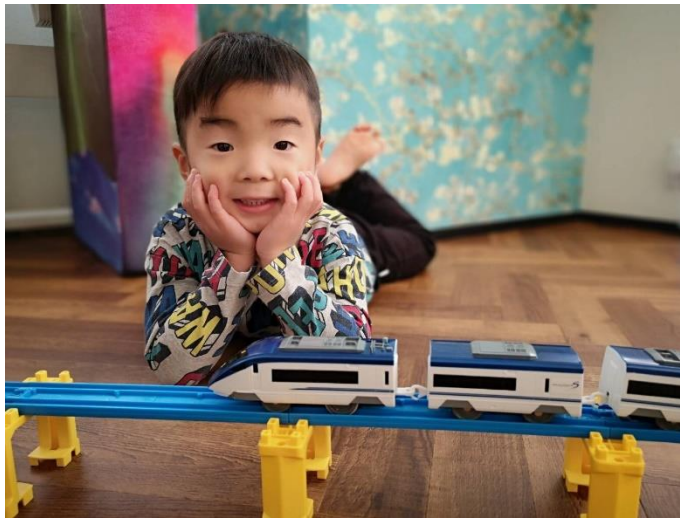
SNS への投稿写真イメージ