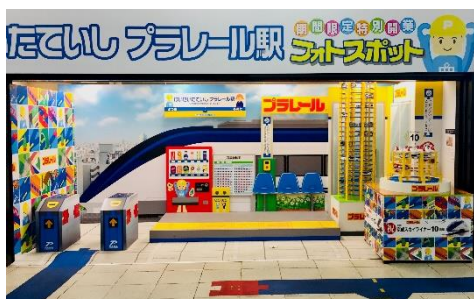
フォトスポット「けいせいたていし プラレール駅」