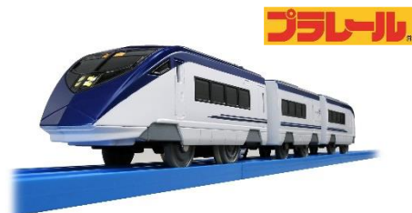
プラレール「S-54 京成スカイライナーAE形」